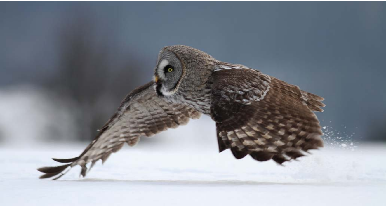
← Z profilu puštík vousatý nápadně připomíná „seříznuté poleno“

Některé druhy sov mohou toto peří pohybem svalů nastavovat. Při porovnání s lidmi mají sovy zhruba padesátkrát lepší sluch a slyší i v oblasti ultrazvuku (zvuky o vysoké frekvenci).